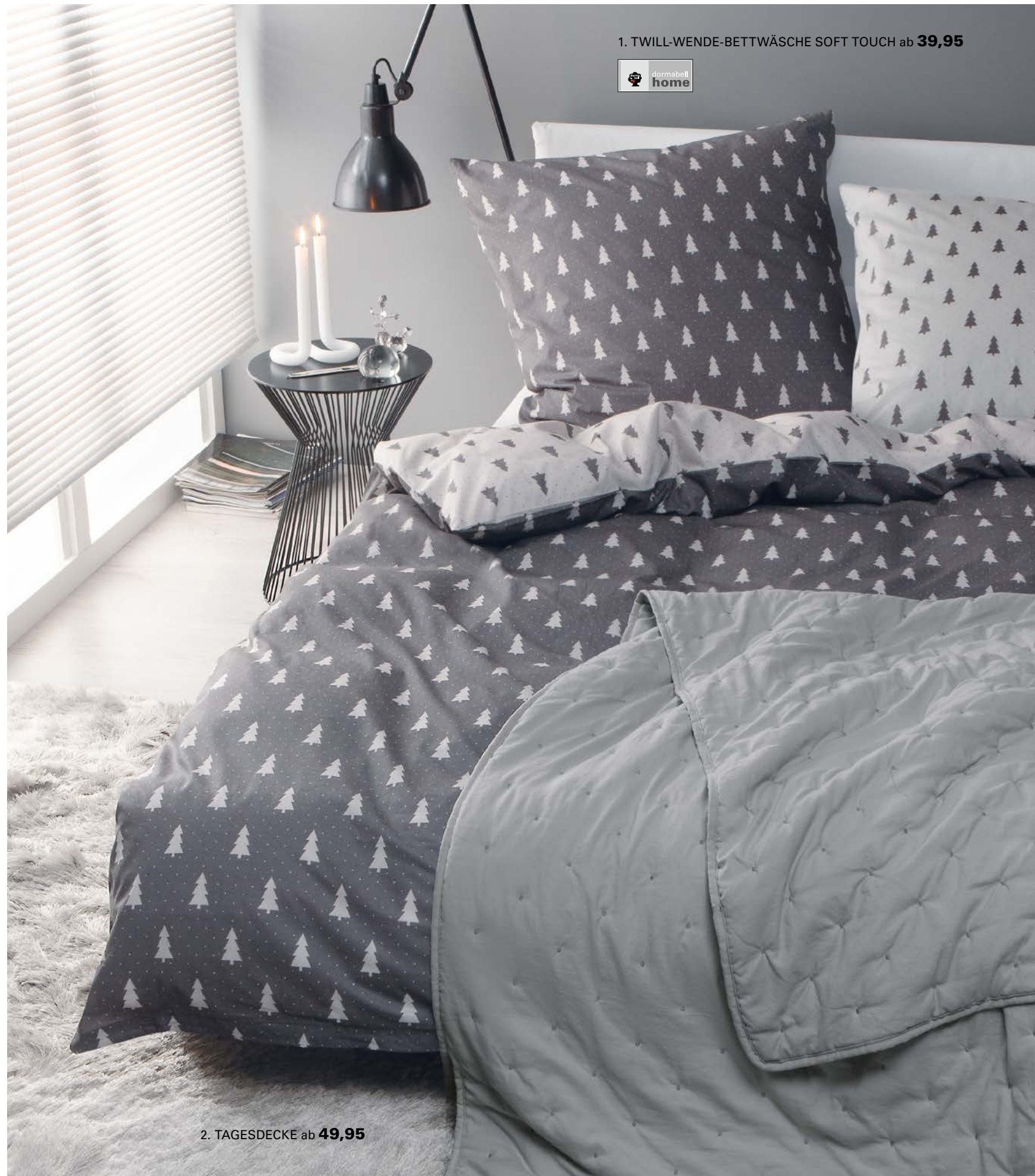
1. TWILL-WENDE-BETTWÄSCHE SOFT TOUCH ab 39,95