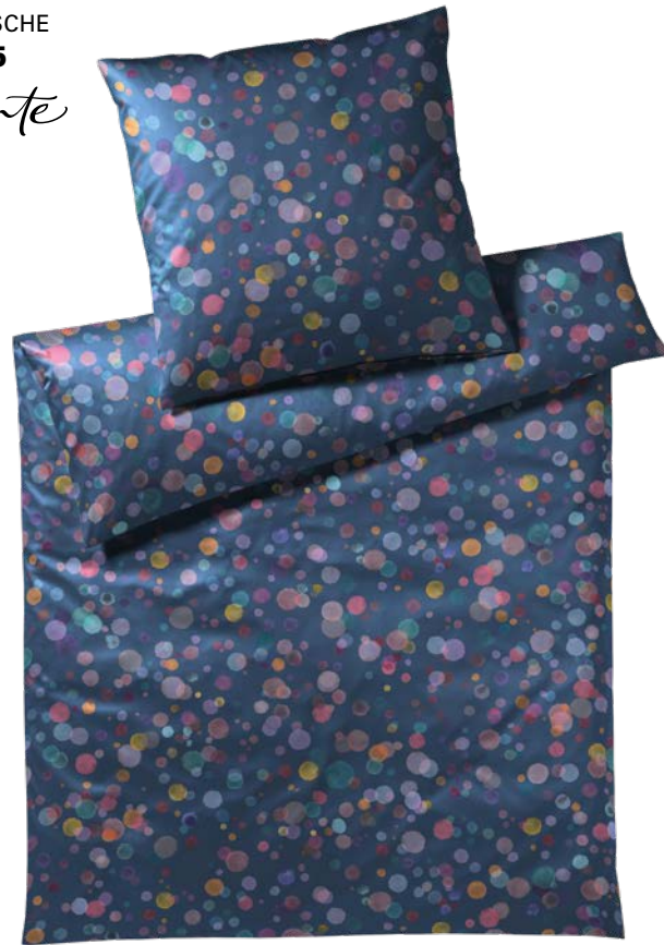
4. INTERLOCK-JERSEY-BETTWÄSCHE ab 99,95