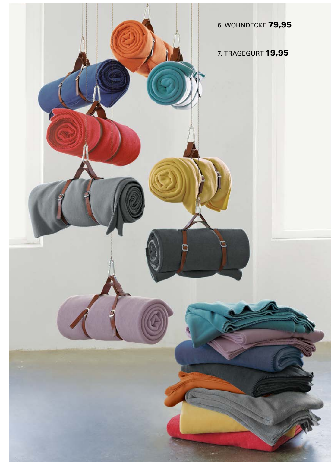
7. TRAGEGURT 19,95

1. SATIN-BETTWÄSCHE: Traumhaft schlafen, inspiriert aufwachen. Ein Erlebnis, das entsteht, wenn sich fantasievolle Muster mit leuchtendem Blau oder frischem Orange und feinstem anschiemsgsamem Satin verbinden. Aus 100 % Baumwolle. Mit Reißverschluss. 135 / 200 cm 99,95, 155 / 200 cm 119,-, 155 / 220 cm 129,-, 200 / 200 cm 189,-. 2. SATIN-KISSENHÜLLEN: So schön und hochwertig wie die dazugehörige Bettwäsche. Seidiger Satin in Blau oder Orange. Aus 100 % Baumwolle. Mit Reißverschluss. 40 / 40 cm 19,95, 40 / 80 cm 24,95. 3. INTERLOCK-JERSEY-BETTWÄSCHE: Fühlt sich wunderbar geschmeidig an und glänzt mit zauberhaftem Pünktchen-Dessin auf edlem Nachtblau – das ganz besondere Verwöhnprogramm fürs Bett. Aus 100 % Baumwolle. Mit Reißverschluss. 135 / 200 cm 99,95, 155 / 200 cm 119,-, 155 / 220 cm 129,-.