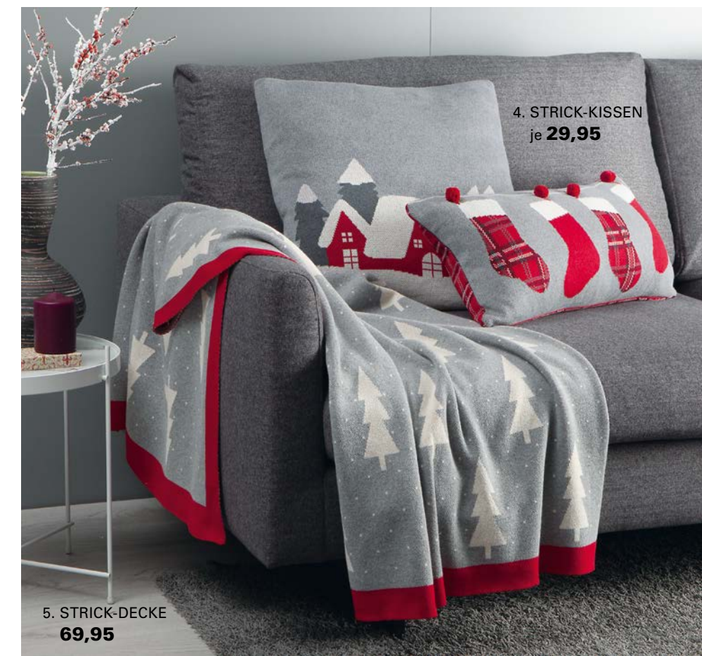
4. STRICK-KISSEN je 29,95