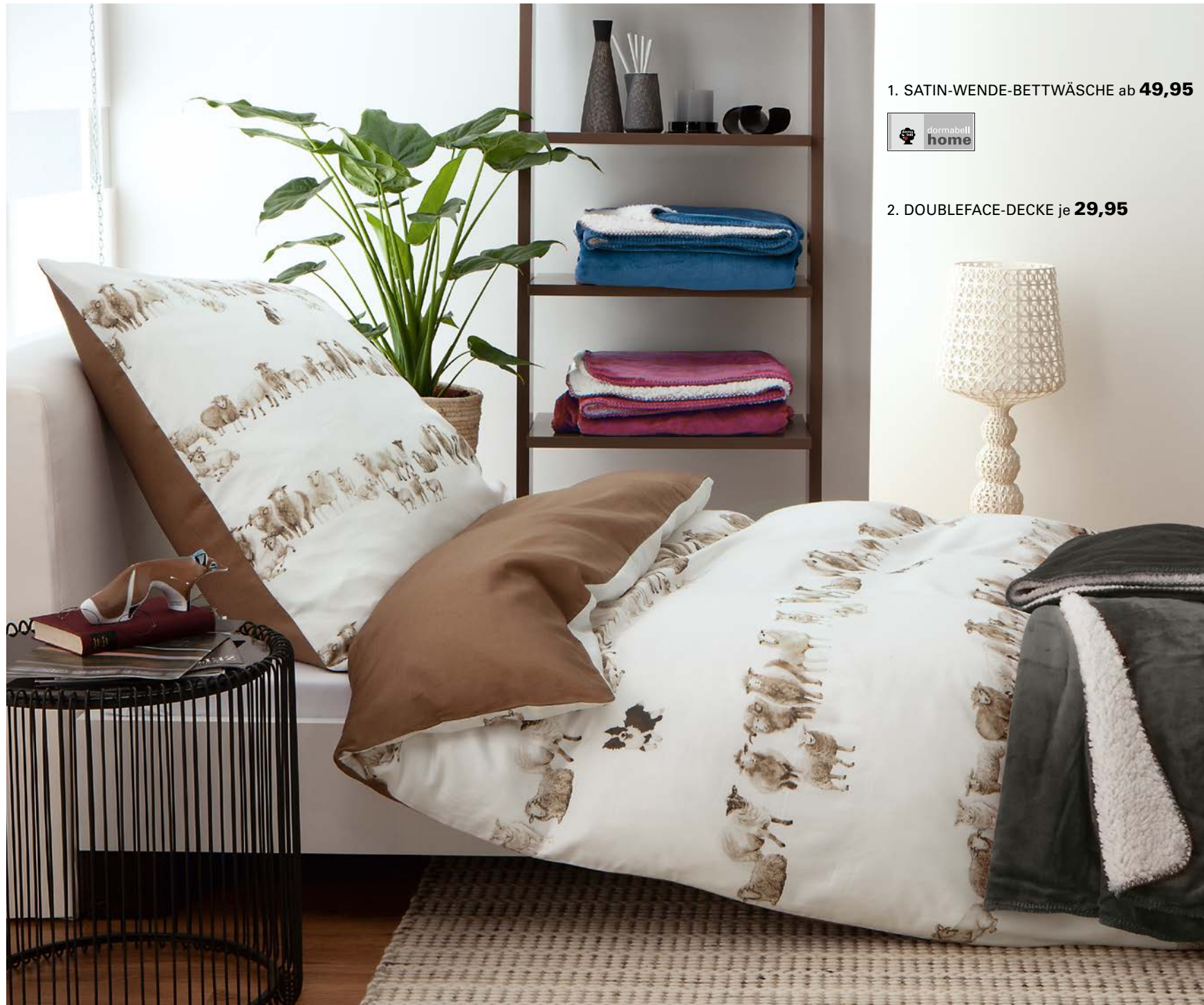
1. SATIN-WENDE-BETTWÄSCHE ab 49,95