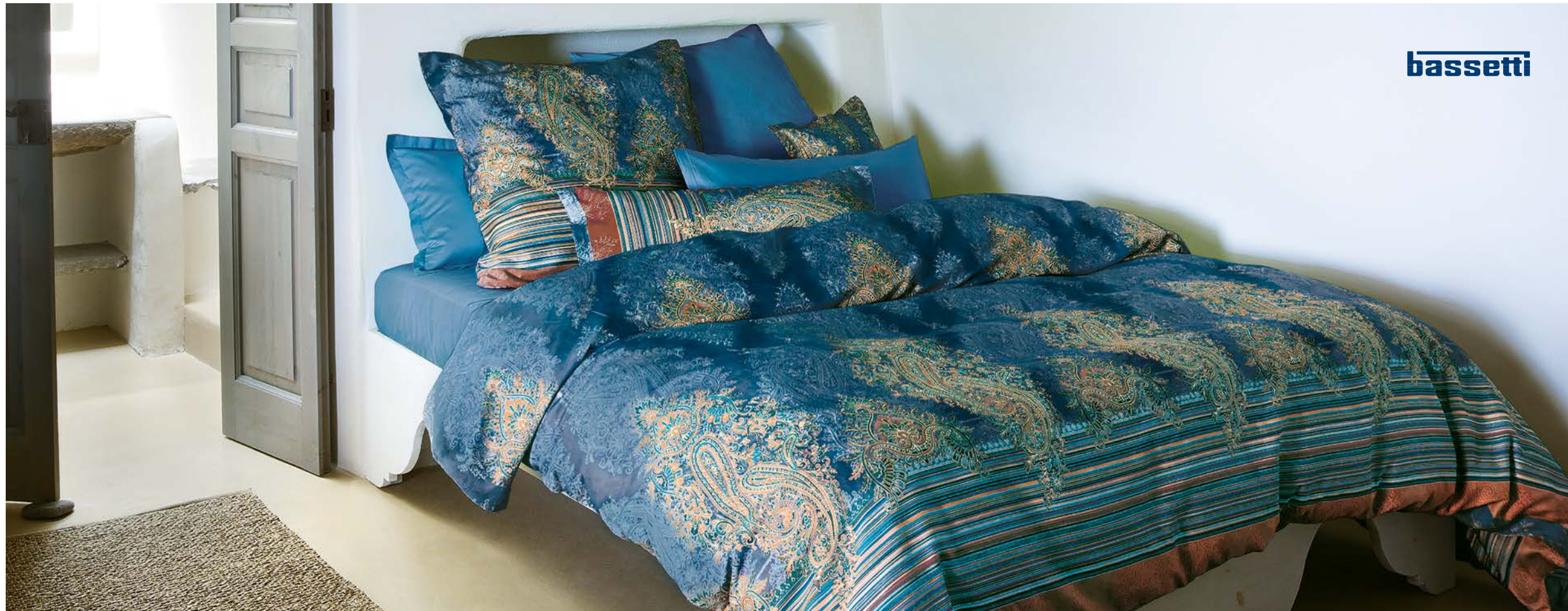
1. SATIN-BETTWÄSCHE ab 99,95